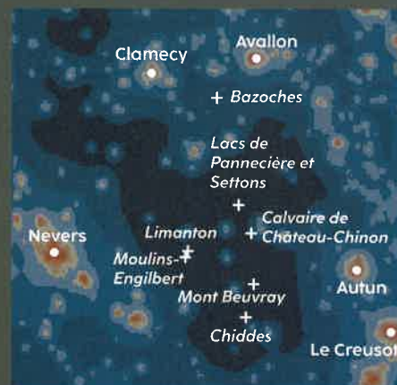
Panorama du ciel vu depuis Chiddes.

amateur recommande : les lacs de Pannecière et de Settons ; le rocher du Chien ; les châteaux de Saint-Léger-de-Fougeret, de Limanton, de Bazoches et de Moulins-Engilbert (extinction à 1 h). Dans le prolongement de cette zone sombre, à 100 km au nord-ouest, signalons encore le jeune parc naturel de Forêt (2019), sur le plateau de Langres. On trouve un chemin dégagé, 500 m au sud du hameau appelé Les Goulles.